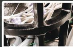
Structure imputrescible sans bois / Timber free frame