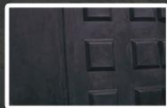
Base moulée en ABS / Molded ABS fiberglass base